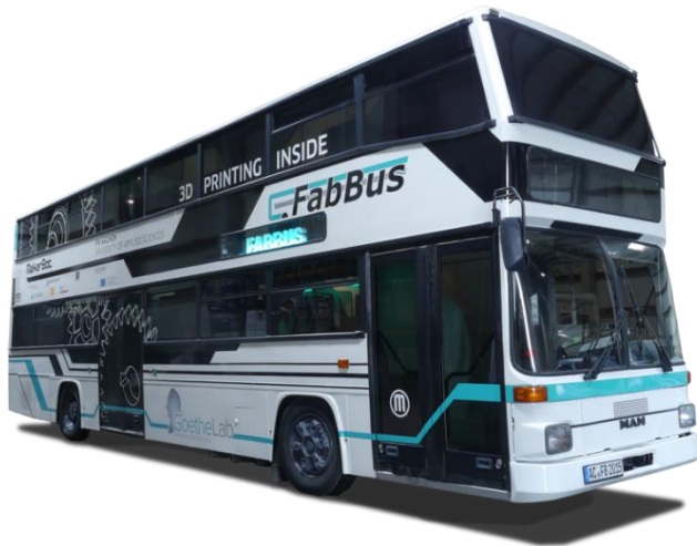
Bild 2: Der FabBus der FH Aachen kommt zum Kunden und bietet 8 Plätze für Aus- und Weiterbildung sowie zwölf 3D-Drucker.

----- PRESSEINFORMATION 29. August 2016 || Seite 4 | 4 -----