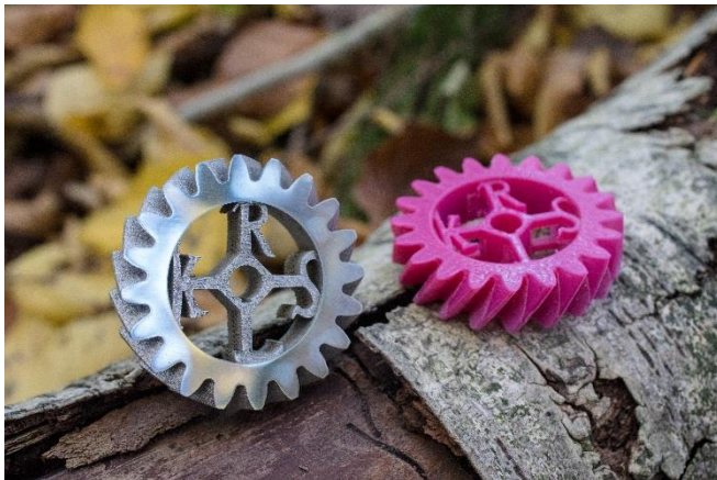
Bild 1: Additive Verfahren für den 3D-Druck von Bauteilen aus Metall oder Kunststoffen stehen im Mittelpunkt der 3D Valley Conference am 14. und 15. September in Aachen.